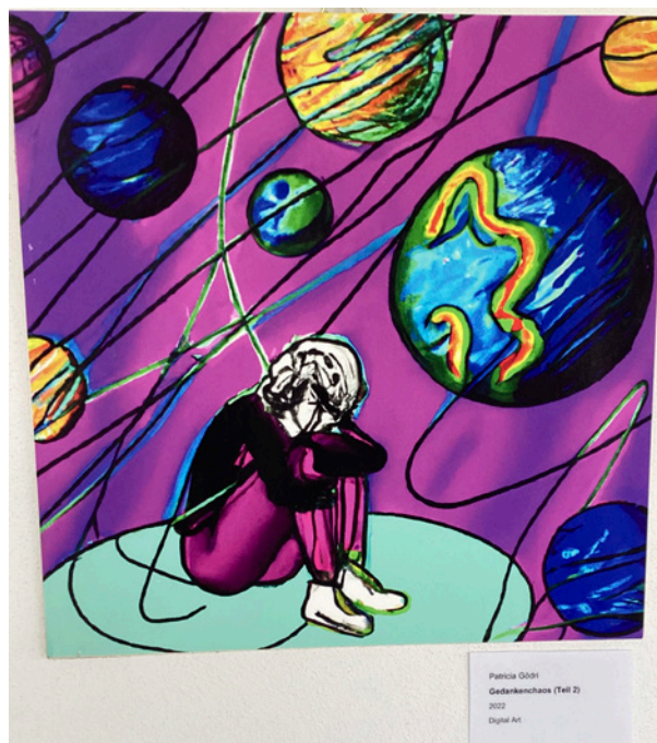
Patricia Oden Gedankenchaos (Teil 2) 2022 Digital Art

Die Kunstreihe SchulART bringt die Werke von Künstler:innen aus der Region mit einem Schreib- und Vortragswettbewerb für Schüler:innen zusammen. Die Künstler:innen stellen ihre Werke in den Räumen der Schule aus und anschließend schreiben die Schüler:innen inspiriert von den Kunstwerken Texte oder zeichnen. Die so entstandenen Werke werden dann auf einer weiteren Ausstellung präsentiert.